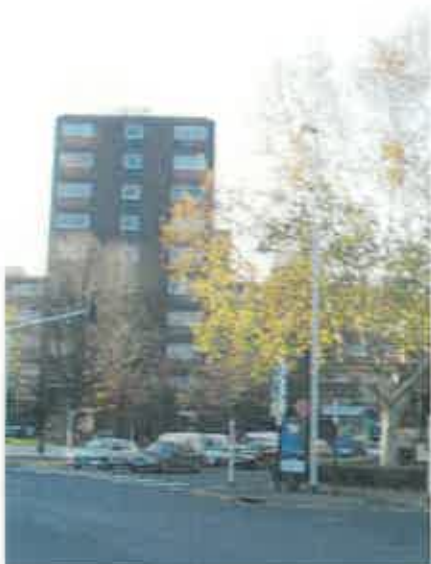
3 avenue Raymond Bergougnan 63100 CLERMONT FERRAND