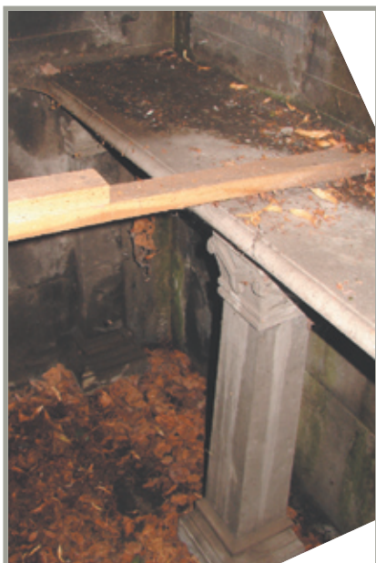
détail 1 : Autel en marbre et en pierre bleue