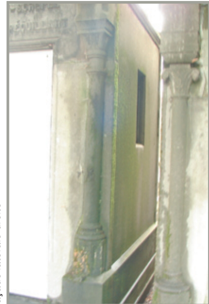
façade latérale droite