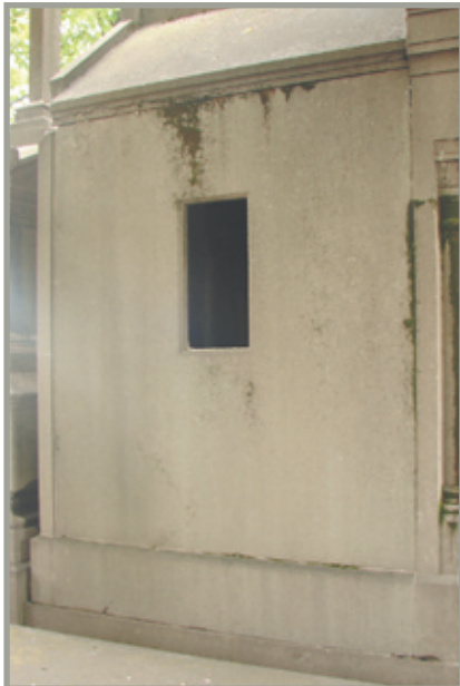
façade latérale gauche