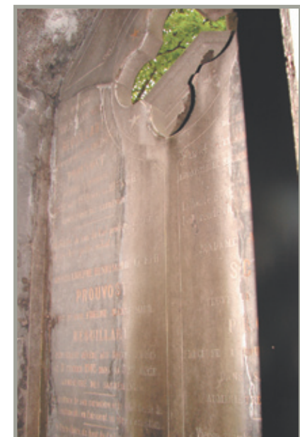
détail 2 : Vue vers le mur de fond