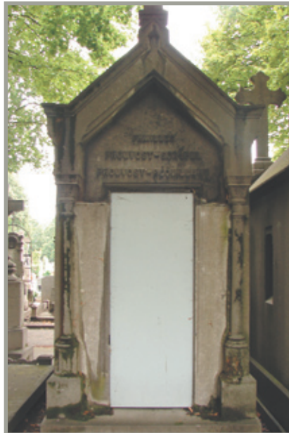
façade principale sur allée